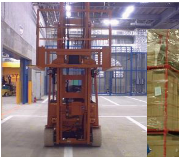
フォークリフト搭載アンテナ