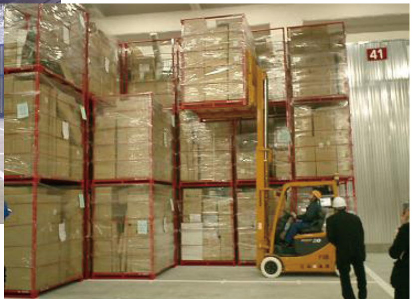
フォーク搭載スキャナ